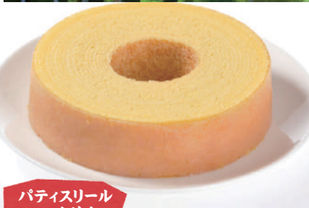
パティスリー フカサク